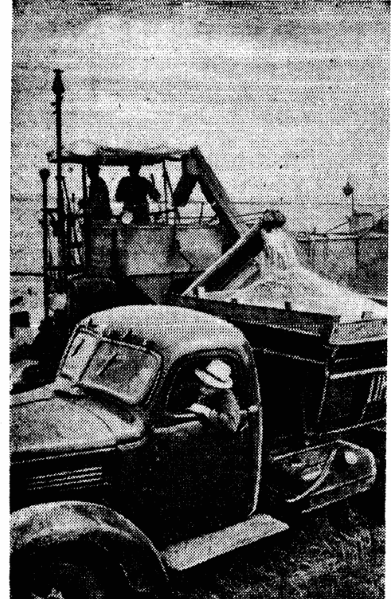
В Алтайском крае идет массовая уборка зерновых культур. Большая часть их будет убрана разделным способом. На снимке: выгрузка зерна из комбайна, работающего в колхозе «Сибирь» Егорьевского района.